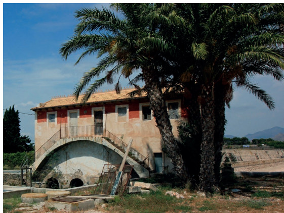
El Pantanet de Mutxamel, punt d'inici de l'actual sistema de reg de l'Horta d'Alacant.

població a l'Horta i un total de 23 torres en un espai de tan sols 25 km 2 .